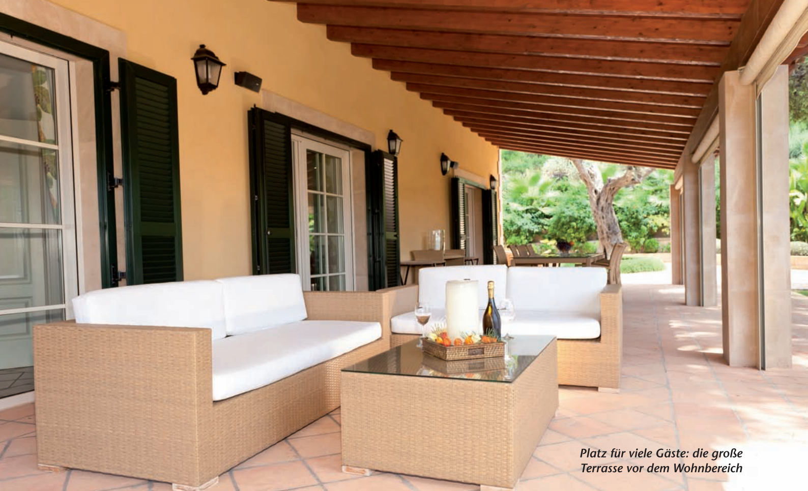
Platz für viele Gäste: die große Terrasse vor dem Wohnbereich