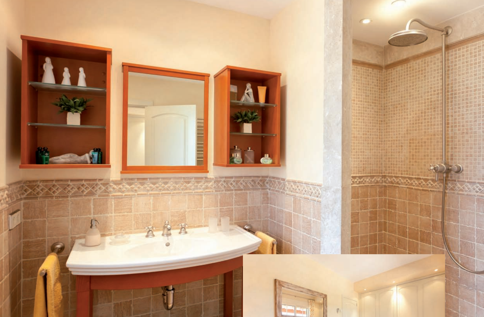
Beste Materialien, solide Bauweise, kostbare Teppiche, Bilder und ausgesuchte Antiquitäten – das zeichnet die im toskanischen Stil gebaute Villa aus

seinem Haus angelegt hat. Und vor der Villa schlanke Zypressen – Toskana-Feeling eben.